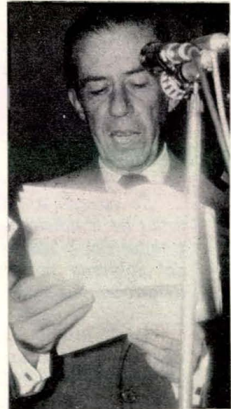
El doctor Arturo Gómez Jaramillo, Gerente General de la Federación Nacional de Cafeteros, se dirige a los asistentes a la inauguración de la Fábrica de Café Liofilizado en Chinchiná.

Vale la pena hacer una pequeña digresión para recordar un fenómeno cotidiano al cual no se le da toda la importancia que tiene en este proceso de exportación: el café como bebida es muy exigente. No es fácil prepararlo en forma adecuada. Cuando no se cumplen los requisitos mínimos, la bebida resulta insatisfactoria. En países con mucha tradición cafetera, productores o consumidores, es frecuente que se ofrezca un producto mediocre, inclusive preparado con muy buena materia prima. Los esfuerzos educativos encaminados a informar a las amas de casa, a los empresarios de restaurantes y de hoteles, etc., son permanentes y no siempre producen los resultados esperados. Si esto ocurre en los países de tradición como consumidores de café, el fenómeno en aquellos que no la tienen es mucho más marcado. Por tal motivo el café soluble encuentra mayores facilidades que el café regular para ganar adeptos en dichos países. Toda expansión del consumo de café es benéfica para los países productores.