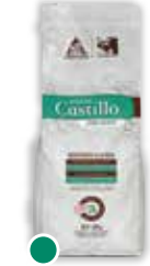
● Castillo® zona Norte