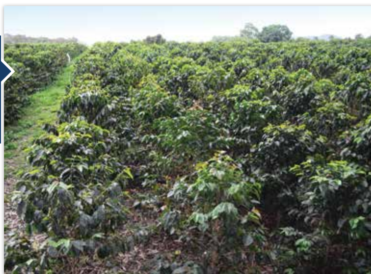
Lote de café Variedad Castillo®.