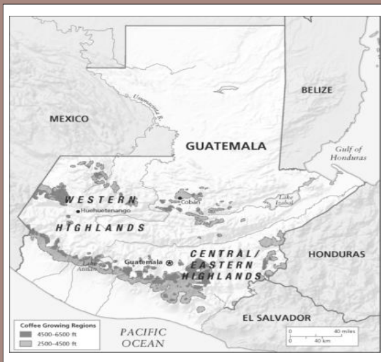
Figura 1. Regiones cafeteras de Guatemala