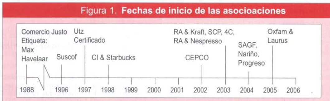
Figura 1. Fechas de inicio de las asociaciones

materiales y humanos son distribuidos a lo largo de la cadena (Gereffi, 1994). Según Humphrey y Schmitz (2001), una cadena es gobernada cuando ciertas empresas fijan y/o refuerzan los parámetros bajo los que operan otros actores de la misma cadena. En particular, los siguientes cuatro parámetros definen el proceso de producción (en su sentido más amplio, incluyendo calidad, logística, y otras fases intermedias de producción) (Humphrey y Schmitz, 2001, p. 4):