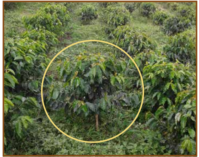
Figura 3. Plantas indicadoras sembradas en las calles y donde se realiza el diagnóstico mensual de la presencia de cochinillas.

Para evaluar la presencia de cochinillas, mensualmente, y durante los primeros 12 meses del establecimiento, se toman sistemáticamente 30 plantas indicadoras distribuidas en todo el lote;