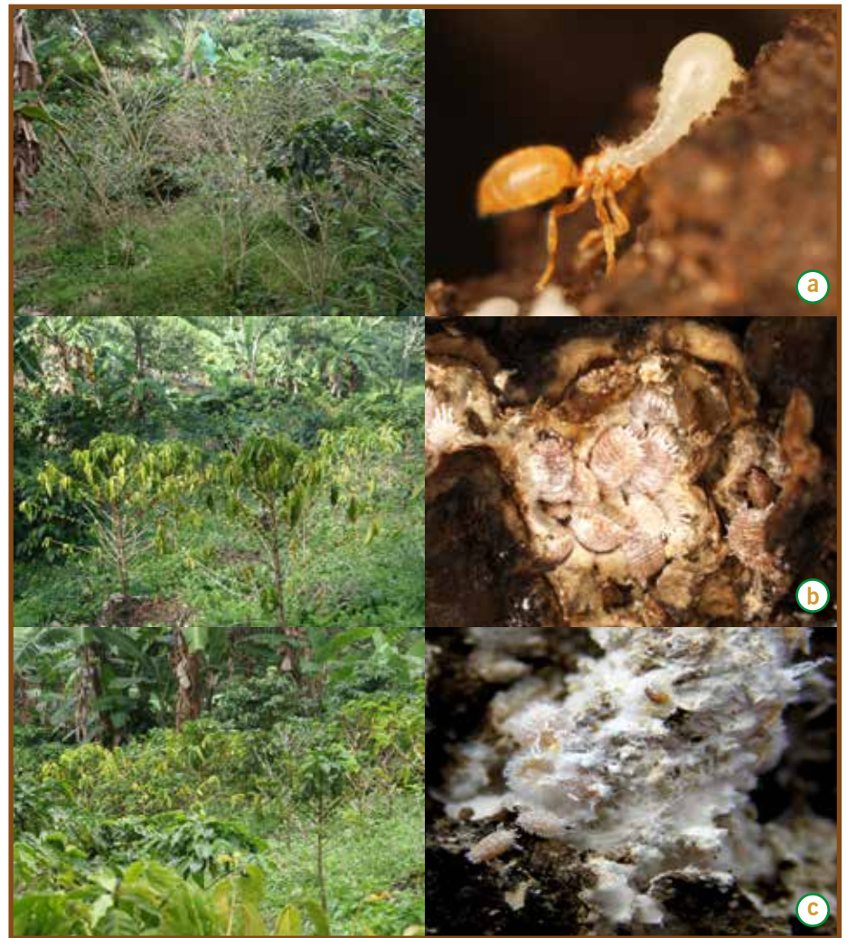
Figura 2. Presencia de cochinillas de las raíces del café. a. Neochavesia caldasiae ; b. Dysmicoccus texensis ; c. Pseudococcus jakobeardisleyi . Estas especies presentan distribución agregada en el lote, por lo tanto, su ataque es por focos.

En almácigos comerciales se recomienda revisar el material antes de sembrarlo siguiendo las recomendaciones anteriores. Si encuentra problemas agronómicos como malformación de raíces, descarte el material y seleccione otro almácigo.