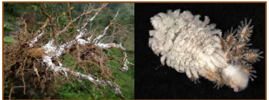
Figura 1. Presencia de Puto barberi en raíces de café.

Las cochinillas se alimentan de la savia elaborada de las plantas y de esta manera ocasionan daños directos en el desarrollo y crecimiento del cultivo, el efecto consiste no solo en el necrosamiento de raíces sino también en que eventualmente ocasionan la muerte de los árboles (2). En Colombia, durante los últimos años se ha incrementado la ocurrencia de las poblaciones de cochinillas de las raíces del café de diferentes especies, siendo Puto barberi (Cockerell) (Hemiptera: Putoidae) (Figura 1), la especie que prevalece y causa los mayores daños. Esta especie tiene una distribución aleatoria, es decir, está presente en todo el lote (4). Se han registrado otras especies de Hemiptera: Pseudococcidae como Dysmicoccus texensis (Tinsley), Neochavesia caldasiae (Balachowsky) y Pseudococcus jackbeardsleyi Gimpel & Miller, que se distribuyen por focos (Figura 2), con síntomas de clorosis y marchitamiento evidentes en la planta, aunque en algunas ocasiones puede tratarse de problemas de llagas (1).