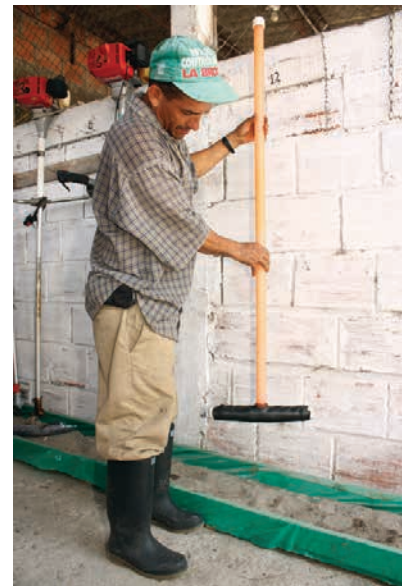
Selector de arvenses listo para ser usado