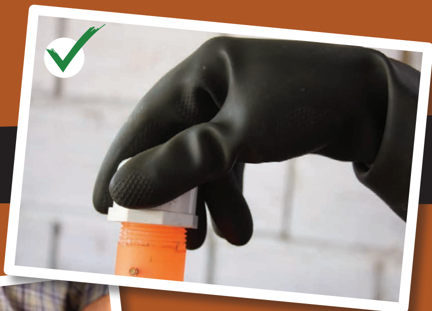
Figura 7. Revisión de la manguera de entrada de aire, la cual debe llegar hasta la base del selector, por debajo de los orificios de salida.