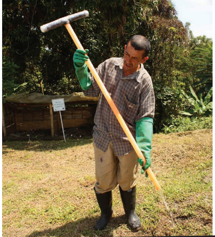
Figura 9. Lavado del selector con agua limpia.