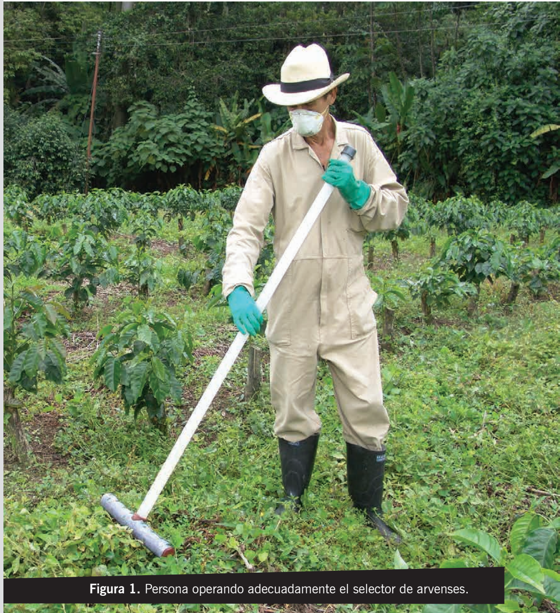
Figura 1. Persona operando adecuadamente el selector de arvenses.

Está construido en polipropileno de alta densidad (PSI). Una de las ventajas de este material, además de su alta resistencia, es que permite observar el nivel del líquido al interior del selector (Figura 2).