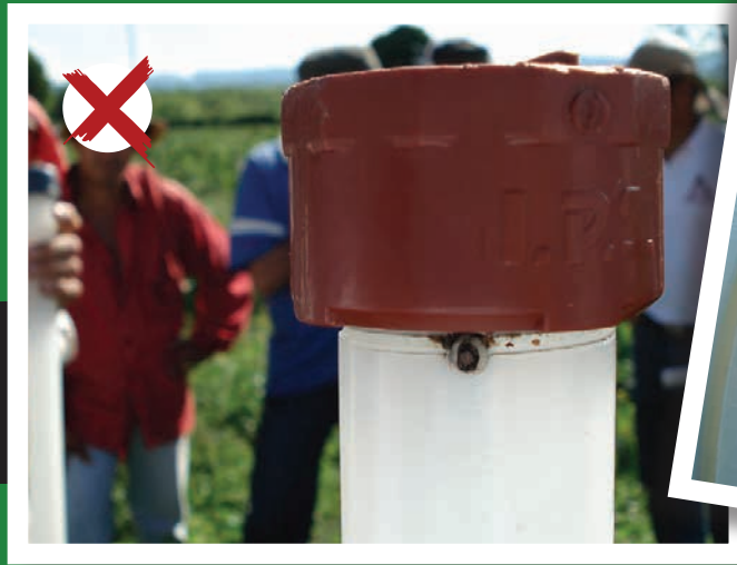
Figura 4. Obstrucción de la entrada de aire al selector de arvenses.