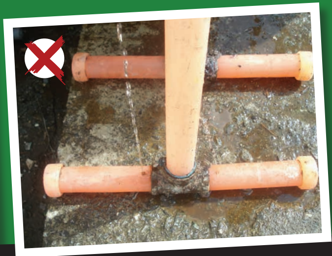
Figura 5. Aditamentos de tubería en hierro galvanizado y aumento del tamaño de los orificios con agujas de mayor tamaño.