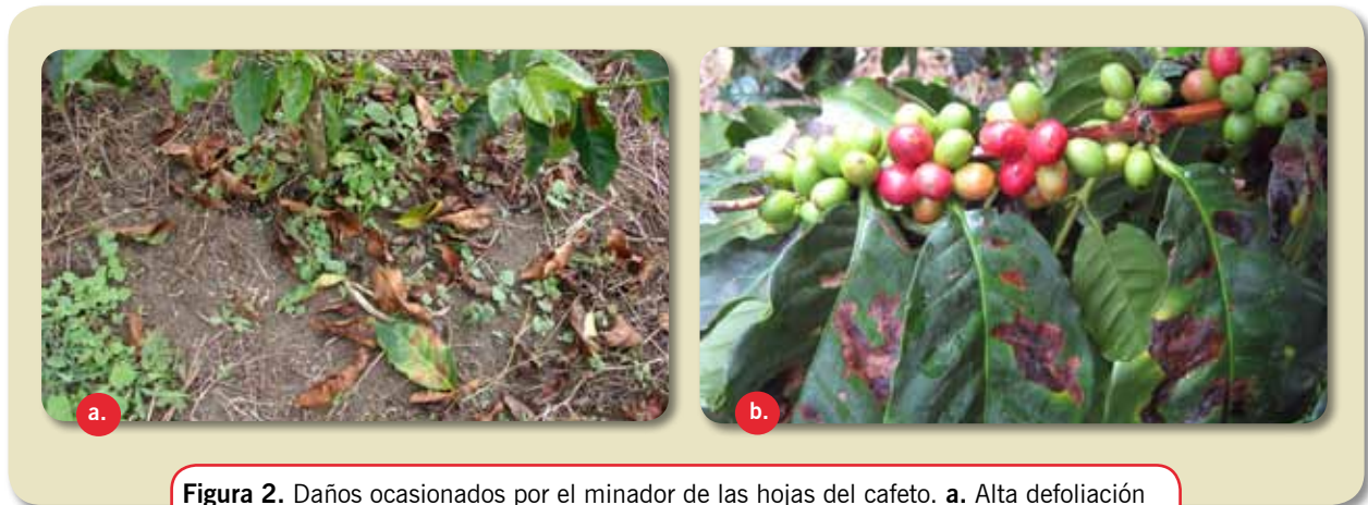
Figura 2. Daños ocasionados por el minador de las hojas del café. a. Alta defoliación en un cafetal afectado por minador; b. Infestación alta de minador en el follaje.

que caídas del 25%, 50% y 75% del follaje resultaron en pérdidas de producción de café del 9,1%, 23,53 % y 87,24%, respectivamente (17,18).