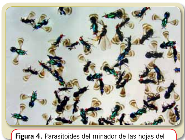
Figura 4. Parasitoides del minador de las hojas del cafeto obtenidos de un total de 100 hojas con minas activas. Sobresale la especie Closterocerus coffeellae .

Para determinar el efecto del control biológico natural sobre las poblaciones del minador en la finca La Sirena, se evaluó el porcentaje de infestación cada 15 días, encontrando una reducción significativa de 30,3% al día 15 a menos del 10% al día 105 (Figura 5). Los parasitoides permitieron mantener las poblaciones de minador por debajo del umbral de daño económico a partir del día 30, sin necesidad de hacer aplicaciones de insecticidas químicos.