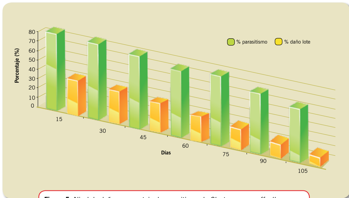
Figura 5. Nivel de daño y porcentaje de parasitismo de Closterocerus coffeellae y Horismenus cupreus en larvas de Leucoptera coffeellum , en un lote de Coffea arabica var. Caturra, a través del tiempo. Finca La Sirena (Neira, Caldas), a 1.700 m.