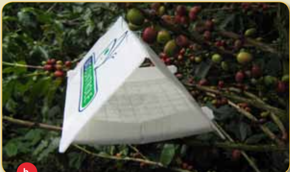
Figura 7. a. Mina depredada por avispas Polistes y Polybia . Nótese el corte bilacerado sobre la mina y la ausencia de larvas de minador; b. Trampa tipo delta cebada con feromona para la captura de adultos de minador.

puedan distinguir las señales enviadas por las hembras, siguiendo falsas pistas emitidas por los liberadores de la feromona sintética. Con esta feromona se satura el sistema olfativo del insecto plaga y los machos quedan perdidos por la cantidad de señales enviadas en el campo. Al perfeccionar esta técnica se podría controlar esta plaga evitando el uso de insecticidas químicos, los cuales han causado problemas de resistencia y desequilibrios en el agroecosistema en Brasil.