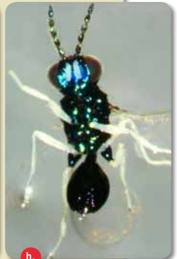
Figura 3. Parasitismo de larvas de minador de las hojas del café. a. Larva parasitada por Closterocherus coffeellae ; b-c. Larva de minador parasitada por Horismenus cupreus , nótese a un lado la larva pequeña del ectoparasitoide; d-e. Pupas del endoparasitoide C. coffeellae dentro de una mina; f. Adulto de C. coffeellae ; g. C. coffeellae parasitando una larva de minador; h. Adulto de H. cupreus

parasitismo, es necesario levantar la epidermis de la mina con una pinza fina o alfiler, bajo un estereoscopio o con el uso de una lupa de mano de aumento 10x,