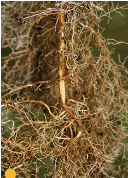
Figura 2. Colino de café con síntomas de deformación de la raíz principal o “cola de marrano”.