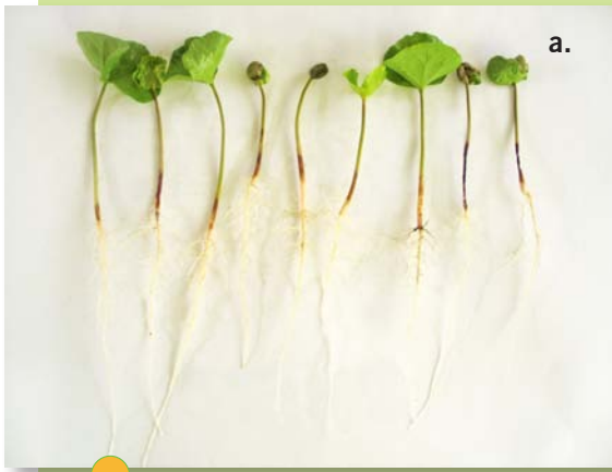
Figura 1. Chapolas con síntomas de volcamiento (a) y chapolas sanas (b).