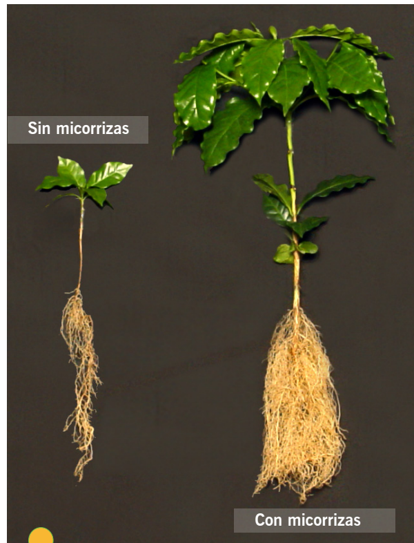
Figura 4. Desarrollo aéreo y radicular de colino de café, por efecto de aplicación de micorrizas.

no responden a la fertilización con DAP (1). Para almácigos propensos a ataques severos, se recomienda complementar el manejo con la aplicación de 4 g/L de ditiocarbamatos (Dithane o Mancozeb) ó 1 ml/L de un triazol (Bayleton CE 250, Punch 40 CE o Alto 100 SL) (5, 8), con intervalos de 30 a 45 días dependiendo de la intensidad de la enfermedad.