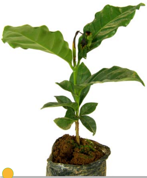
Figura 5. Planta de almácigo atacada por Phoma spp.

El hongo Phoma spp. puede causar graves problemas en almácigos ubicados a altitudes mayores a 1.600 m. Este hongo se ve favorecido por corrientes fuertes de aire frío, para lo cual se recomienda instalar barreras rompivientos y polisombra (Figura 5). Si se requiere control químico puede aplicarse clorotalonil (Daconil, 2,5 g/L) (16).