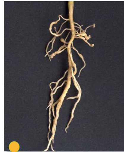
Figura 3. Raíz de chapola de café afectada por nematodos del nudo radical.

que le de énfasis a la profundidad, permite un adecuado crecimiento de la raíz durante los primeros 4 meses. Si se planea mantener el almácigo por un período de hasta 6 meses, es necesario utilizar una bolsa de mayor capacidad, 2,0 kg aproximadamente. Almácigos de mayor edad son propensos a presentar los problemas antes mencionados, por lo que no son adecuados para el trasplante en el campo.