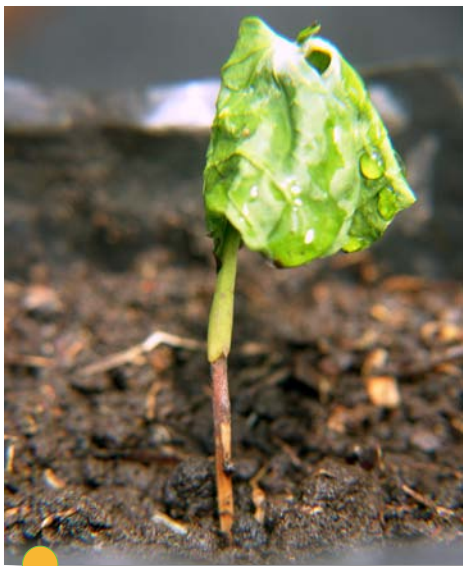
Figura 6. Síntomas en el cuello de la raíz por causa de una siembra profunda.

Tanto en la siembra de las chapolas en las bolsas como durante el trasplante en el campo, debe asegurarse que el cuello de la raíz quede al nivel del suelo y no a una profundidad mayor. Tallos enterrados en hoyos muy profundos terminan en un ambiente que no es favorable para la fisiología de su epidermis, lo que hace que los tejidos se afecten y se conviertan en una vía de entrada para microorganismos del suelo, que al invadir el interior obstruyen el movimiento de agua, nutrientes y hormonas entre la parte aérea y la raíz, ocasionando la muerte de la planta. Las hojas se aprecian con clorosis y epinastia (curvatura hacia abajo), y al extraer la planta del suelo se observa un anillamiento por encima del cuello de la raíz (Figura 6). En su interior, el tronco presenta pudrición, y en algunos casos coloraciones púrpuras, indicativo de las infecciones por hongos del género Fusarium . Este síntoma no se encuentra en parches en el lote, sino distribuido de manera homogénea. No hay manera de corregir este problema, salvo eliminar