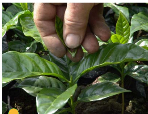
Figura 8. Práctica de descope de colinos.

En lo que respecta a las cochinillas harinosas, se hace necesario realizar un muestreo del lote a sembrar, el cual puede hacerse al observar si las chapolas que se encuentran en el suelo presentan cochinillas, en cuyo caso es necesario hacer una aplicación al hoyo del insecticida en polvo recomendado (clorpirifos) e incorporarlo con la tierra del hoyo en donde se sembrará la planta. Si es necesario hacer aplicaciones de cal en el